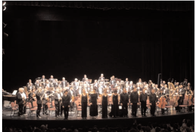
Sinfonia de Luciano Berio - Buenos Aires