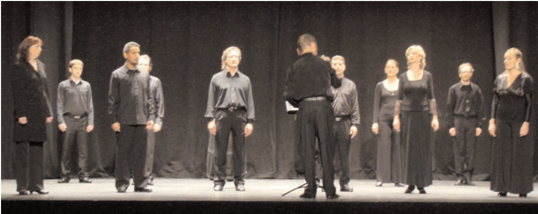
Grand Théâtre de Caceres, 30 octobre 2010