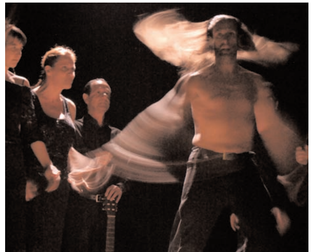
Cantos de amor - Teatro Dona Cano, Santo Amaro (Bahia, Brésil) - novembre 2009