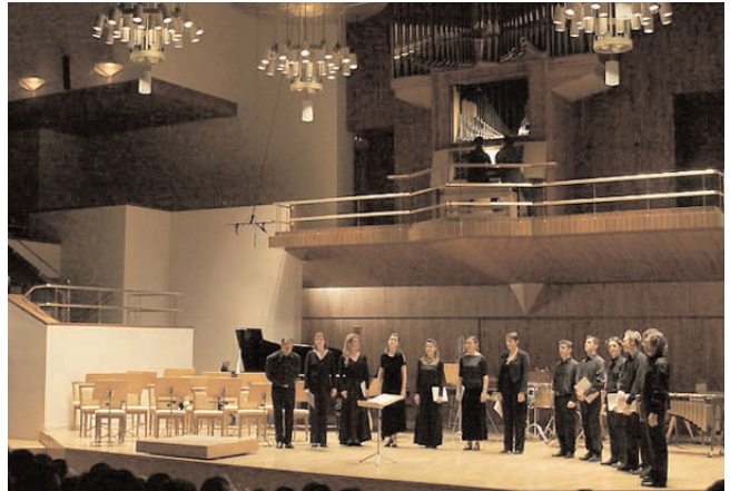
© Maurice Danos - Soli-Tutti, Auditorium national de Madrid, 2005