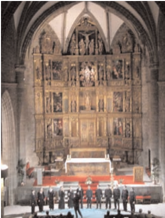
Colmenar Viejo, 2005