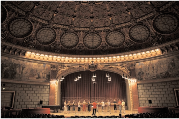
Soli-Tutti, Atheneum de Bucarest, 2007