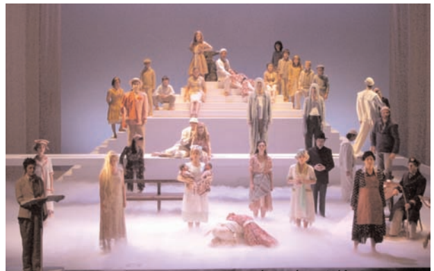
Janvier 2008 - Soli-Tutti, Au Bois Lacté , Opéra-Théâtre de Metz