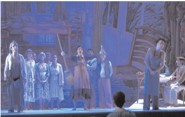
Soli-Tutti, Au Bois Lacté , Opéra-Théâtre de Metz

Au Bois Lacté , opéra de François Narboni pour voix d'après Under Milk Wood de Dylan Thomas, dans une mise en scène d'Antoine Juliens (création)