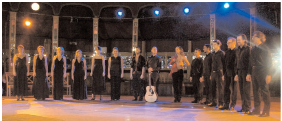
Le Dansoir, Paris, 12 novembre 2010

Ce programme a donné lieu à 7 concerts à Badajoz, Mérida, Plasencia, Caceres, Madrid et Paris (Institut Cervantes et Le Dansoir), ainsi qu’à des ateliers de musique vocale et à deux “conférences de presse musicales”.