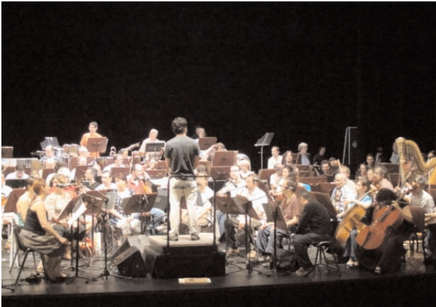
répétition Sinfonia de Luciano Berio - Buenos Aires

Sinfonia de Luciano Berio avec l'Orchestre Symphonique National d'Argentine sous la direction d'Alejo Pérez, le 30 octobre 2009