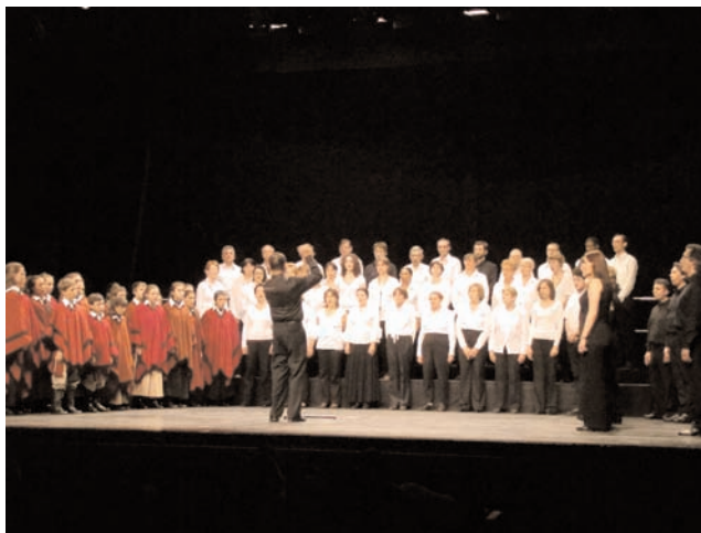
Rencontres chorales autour de la musique russe, Fontenay, 2009 - Rencontres chorales autour de la musique argentine, Gagny, 2010