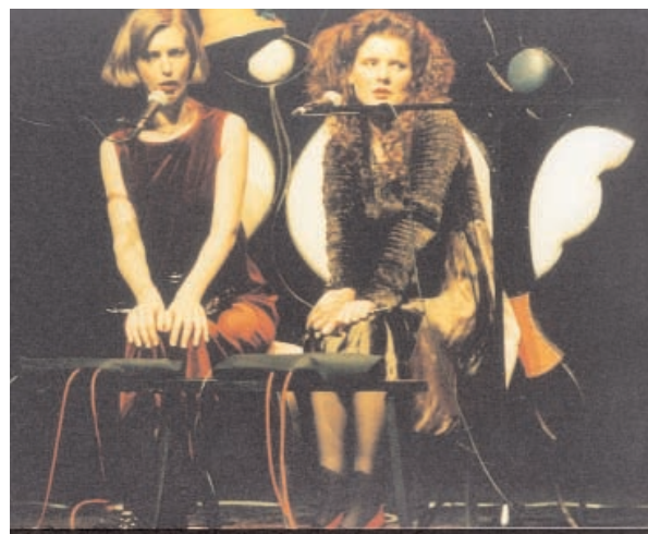
A-Ronne de Luciano Berio - Centre Pompidou, 1997